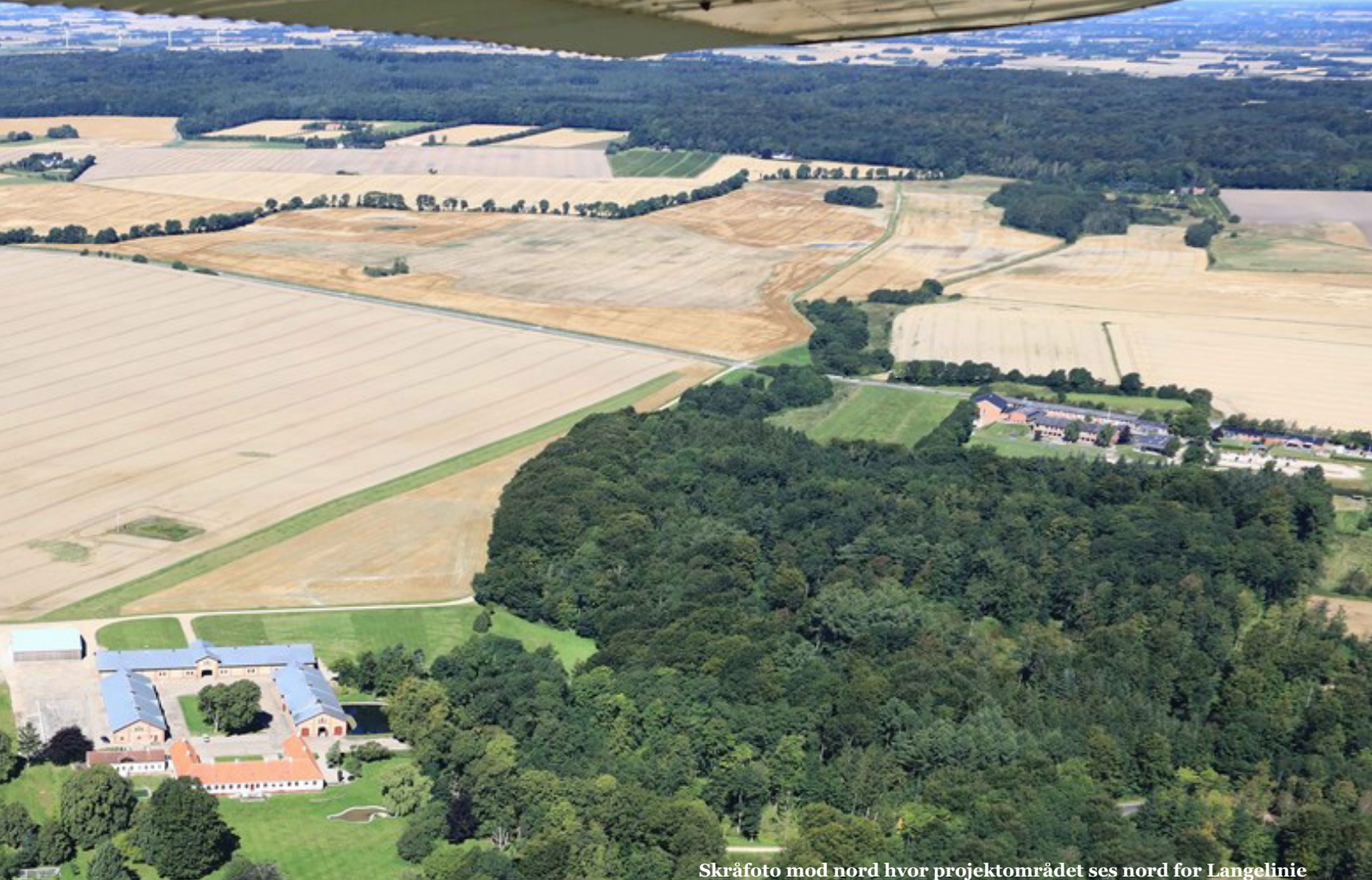
Skråfoto mod nord hvor projektområdet ses nord for Langelinie